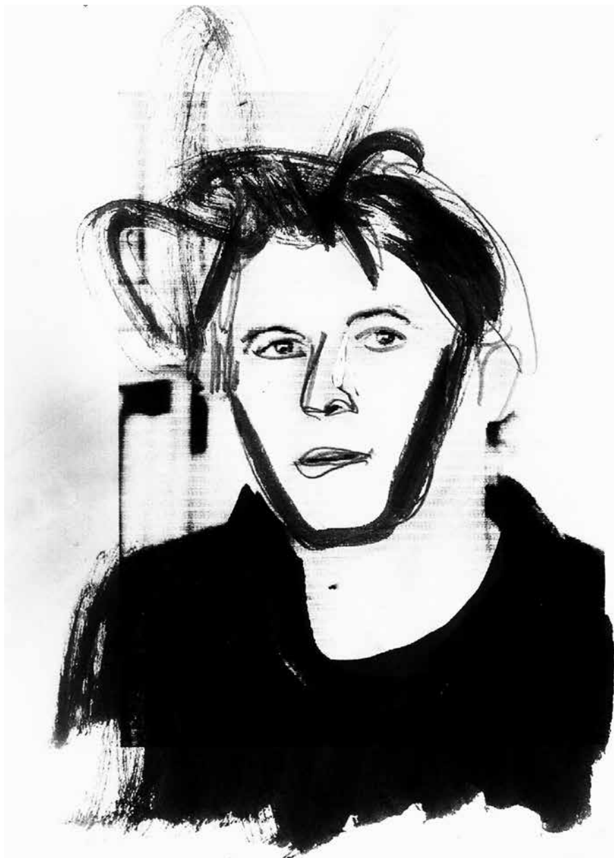
צייר: רוני סומק, מתוך התערוכה: תמונה קבוצתית עם חברים, מוזיאון רמת גן